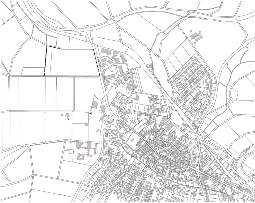
Räumlicher Geltungsbereich des Bebauungsplans Nr. 13 „Erweiterung Gewerbegebiet“

Die Nationalparkstadt Waldeck folgt mit dem Aufstellungsbeschluss den Zielen der Regionalplanung (Weiterentwicklung von gewerblichen Bauflächen am nördlichen Siedlungsrand des Stadtteils Sachsenhausen) sowie den Entwicklungszielen des Flächennutzungsplans, der im Westen der Korbacher Straße (Bundesstraße 458) „Gewerbliche Bauflächen Planung“ darstellt.